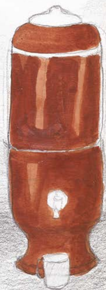
Ilustração: "De barro" Fábria Schnoor - 2011